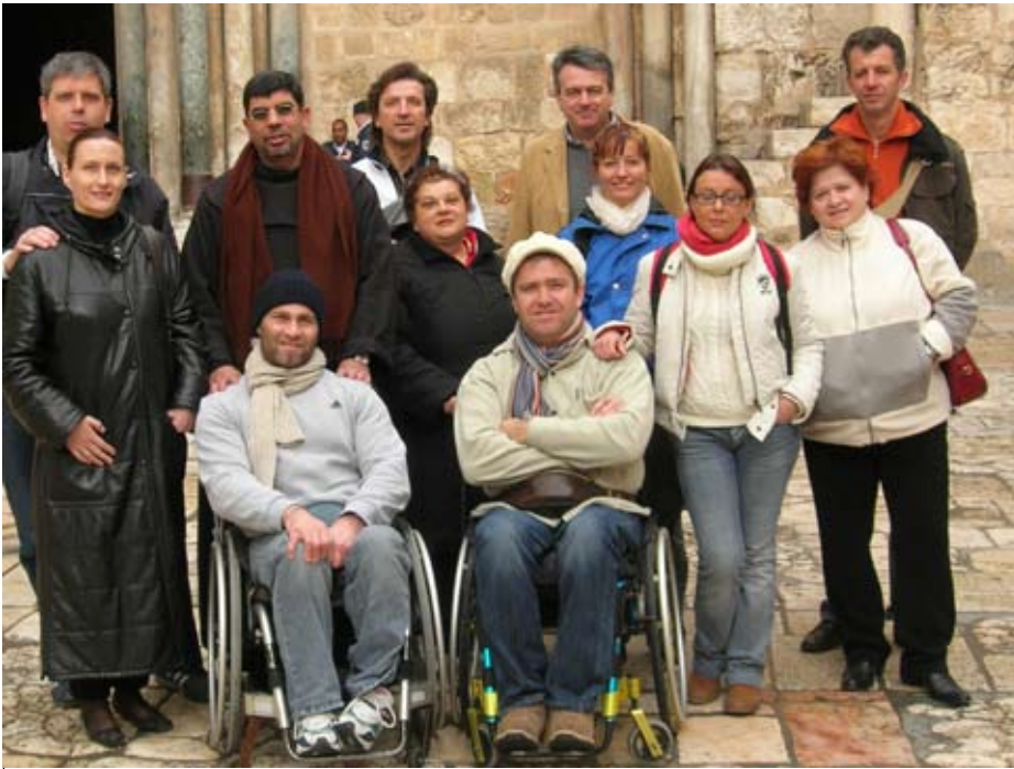
Dopo la visita al Santo Sepolcro e al Calvario, Terzo scatta una foto ricordo. Non si tratta di una semplice cartolina, ma dell'istantanea che misura la "leggerezza dell'essere". L'accumulo di sensazioni forti ha ormai segnato i nostri volontari e ciò traspare dalle espressioni tutte simili dei volti.