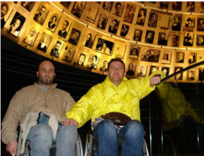
La grande volta degli ebrei morti nei campi di concentramento. Sotto la volta un pozzo profondo e l'acqua che riflette il volto di chi si affaccia e lo accomuna, simbolicamente, ai tanti martiri della shoà.

dove sono morti 6 milioni di ebrei, zingari dell'etnia Rom e dissidenti politici, si dipanano con una scientificità e un patos che fanno capire come sia indispensabile, in ogni società, comprendere sul nascere gli elementi che portano al razzismo. Troppo spesso un certo qualunquismo consente e quasi favorisce l'insorgere della discriminazione in tutti i sensi. Battersi contro la discriminazione significa garantire la sopravvivenza della società democratica.