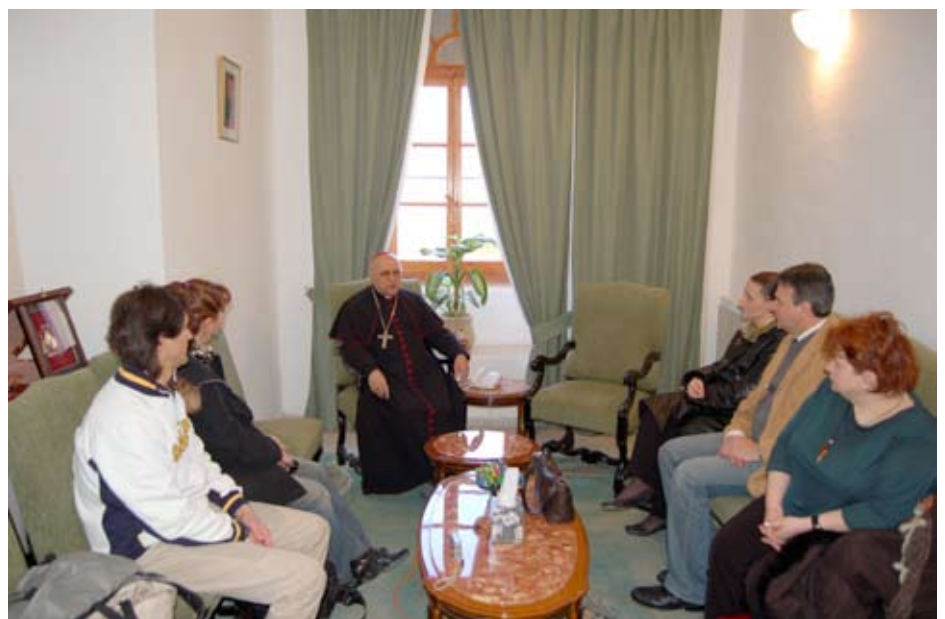
Poche parole, ma forti. Il Patriarca Latino di Gerusalemme ha le idee chiare sulla Palestina.

sa il conflitto fra arabi palestinesi e ebrei israeliani, fra musulmani dell'Asia Minore e dell'Africa e Occidente ebreo, cattolico, protestante, pagano. In quel centro del mondo, in quel cuore universale dell'umanità, è necessario cercare la soluzione, la chiave che apre la