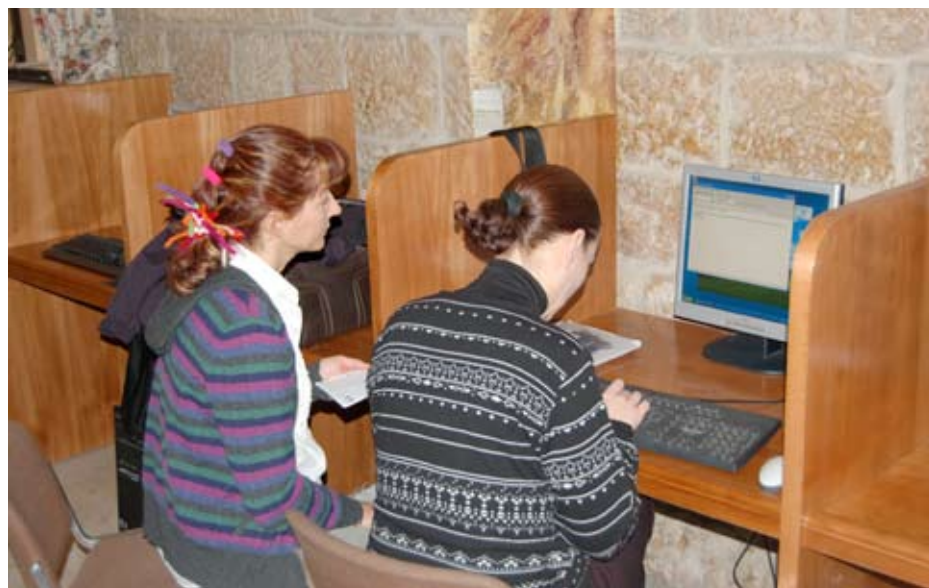
Le nostre giornaliste all'opera nel box dell'albergo Notre Dame di Gerusalemme. Nella controversa situazione di etnie e religioni, Notre Dame è la più originale: si tratta di territorio appartenente alla Città del Vaticano.