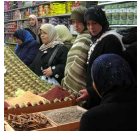
Donne arabe nel Suk di Gerusalemme. I loro occhi sono l'espressione della dignità di un popolo dalla cultura millenaria, con un grado di civiltà da fare invidia a noi occidentali.

fondata in Israele da Erode Antipa nel 25 d.C., si è svolta il 4 gennaio 2007 la 30° maratona.