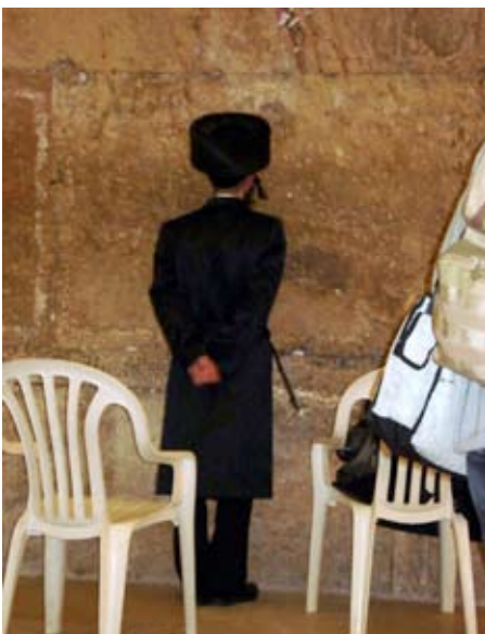
Il Muro del Pianto, appoggiato sulle sue enormi contraddizioni, è il luogo sacro per eccellenza della religione ebraica. Anche noi percepiamo la sacralità del luogo, ultimo baluardo ancora eretto del tempio di Gerusalemme.

dove sono morti 6 milioni di ebrei, zingari dell'etnia Rom e dissidenti politici, si dipanano con una scientificità e un patos che fanno capire come sia indispensabile, in ogni società, comprendere sul nascere gli elementi che portano al razzismo. Troppo spesso un certo qualunquismo consente e quasi favorisce l'insorgere della discriminazione in tutti i sensi. Battersi contro la discriminazione significa garantire la sopravvivenza della società democratica.