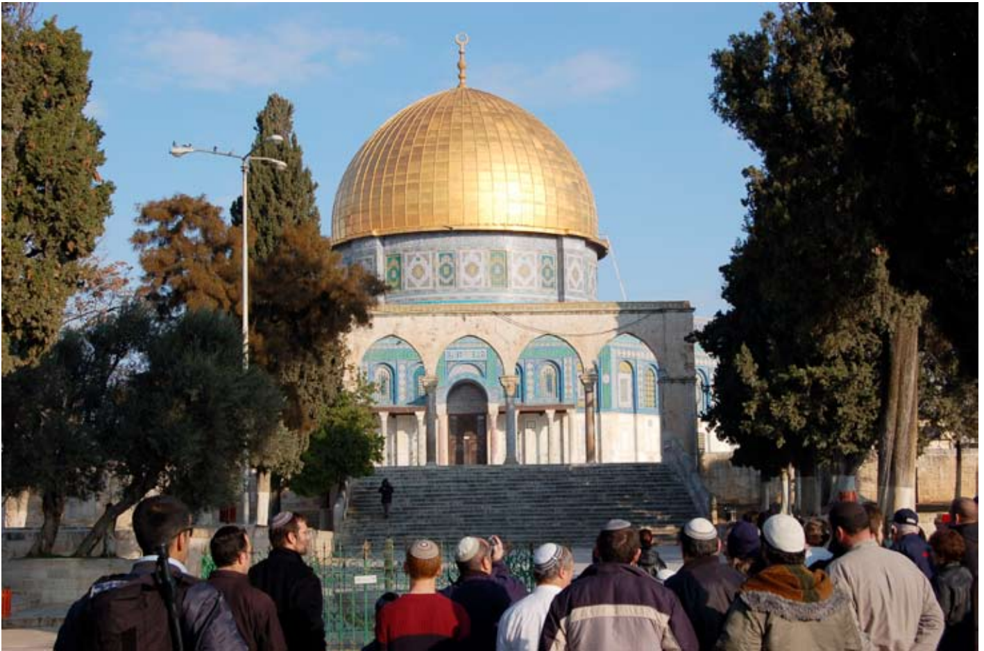
Un gruppo di giovani ebrei con la caratteristica kippa sulla spianata delle moschee ammira la Grande Rocca, la moschea che probabilmente ha preso il posto dell'antico tempio di Gerusalemme. La stratificazione delle simbologie dei riti è molto frequente in ogni parte del mondo e fra tutte le religioni, ma qui acquisisce un significato simbolico eccezionale.